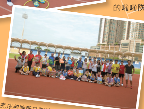
完成慈善競技賽後參加者一同大合照