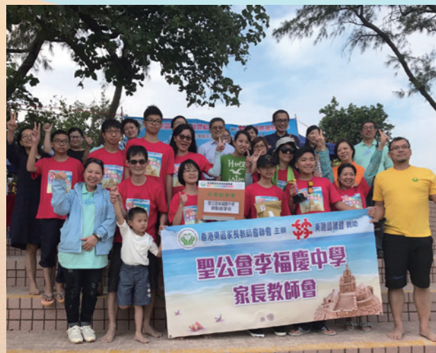
本校家長教師會榮獲堆沙比賽——中學組季軍

家教會於11月5日參加「香港東區家長教師會聯會」舉辦的「2017 親子堆沙比賽暨繽紛同樂日」。是次比賽主題為「運動多面睇」，我們以「運動金字塔」迎戰，最後本校榮獲中學組季軍。當日老師、家長及學生一起合作，充分發揮團隊合作精神，透過是次活動，增進親子感情，大家都留下美好回憶。