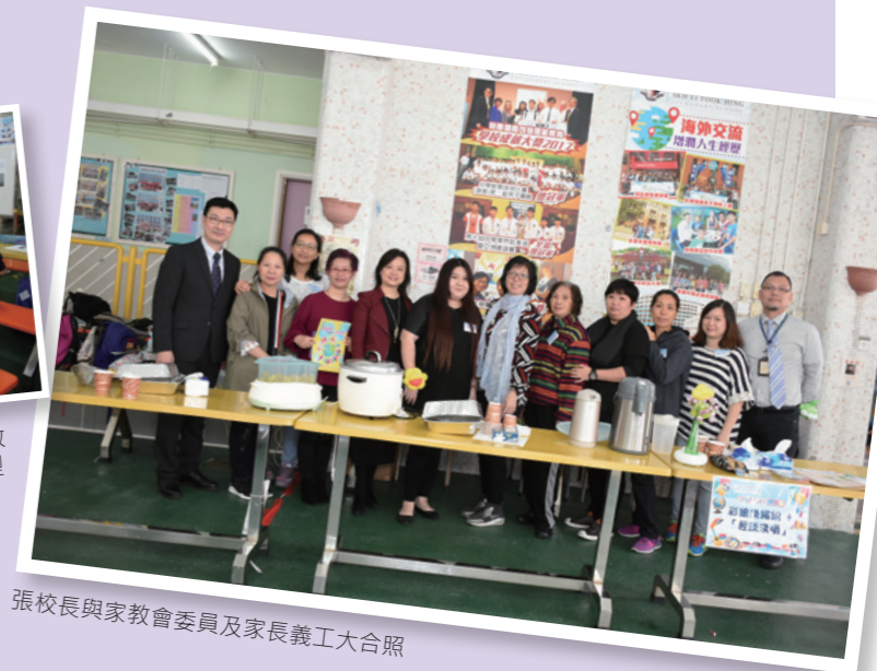
張校長與家委會委員及家長義工大合照