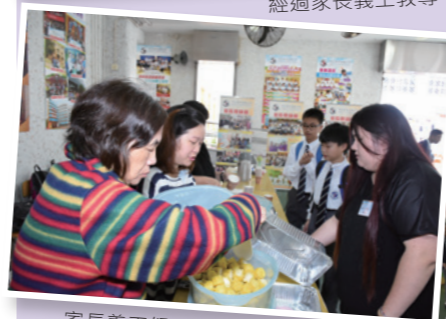
家長義工努力為來賓準備小食