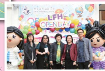
校長與來賓在校門留影

開放日的活動「動」、「靜」兼備。校園內佈滿各科組的攤位遊戲、趣味實驗及成果展覽，老師和同學均竭盡所能，熱情招待來賓，遊戲亦生動有趣，人流絡繹不絕，場面熱鬧。禮堂內的師生才藝表演同樣精彩絕倫，充分展現師生的潛能，讚嘆之聲不絕。