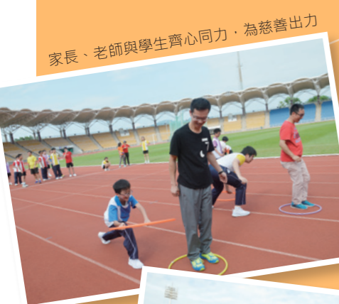
家長、老師與學生齊心同力，為慈善出力

是次活動所籌得的善款已全數撥捐「長者安居協會」為長者購買平安鐘，為整個活動畫上了圓滿的句號。