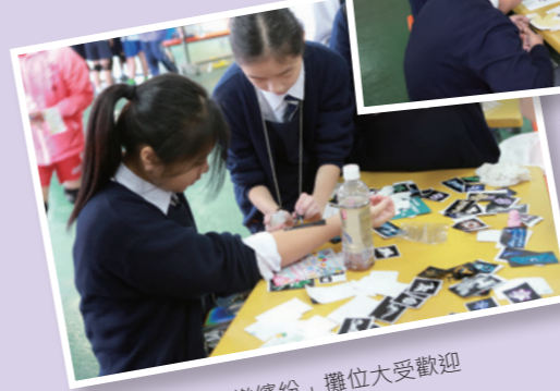
「彩繪樂繽紛」攤位大受歡迎