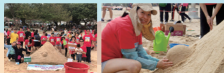
老師、家長及學生在 家長齊心協力打造作品 作品前大合照