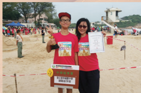
家長與學生渡過一個溫馨愉快的下午