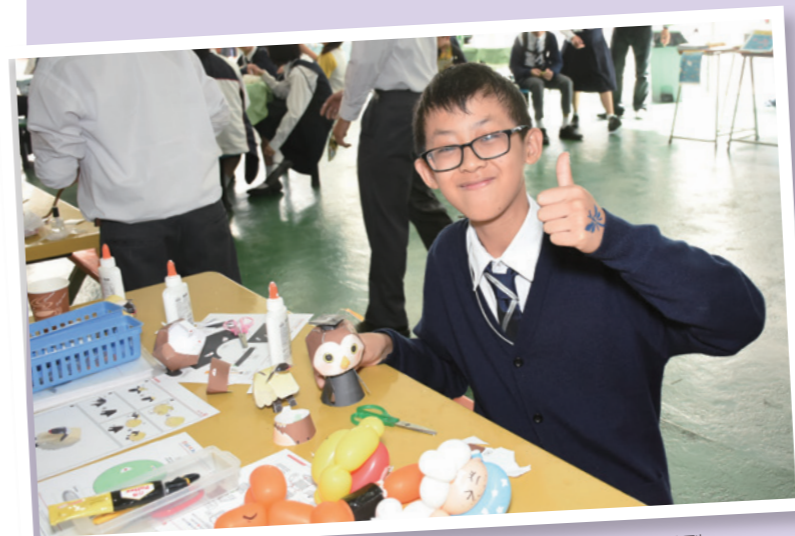
經過家長義工教導，學生順利完成製作紙模型