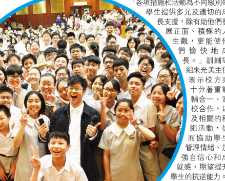
流行歌手到校當揚正能星