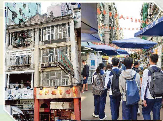
香港地區考察活動