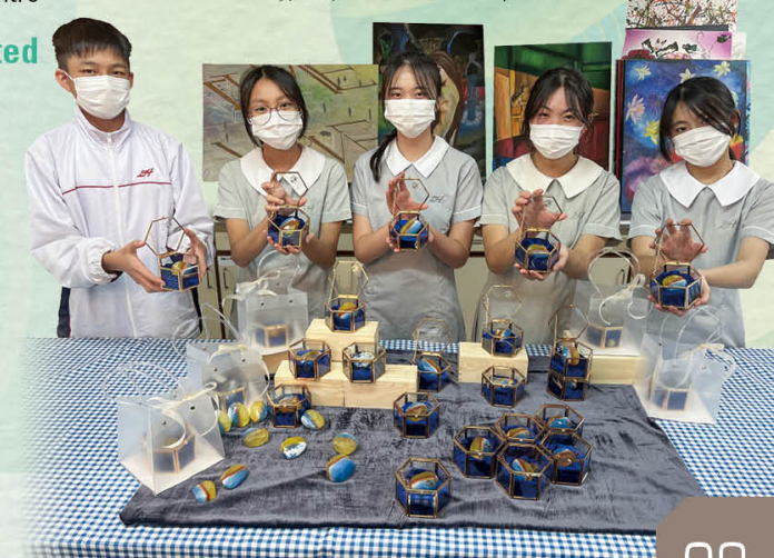
寶石手工皂紀念品工作坊