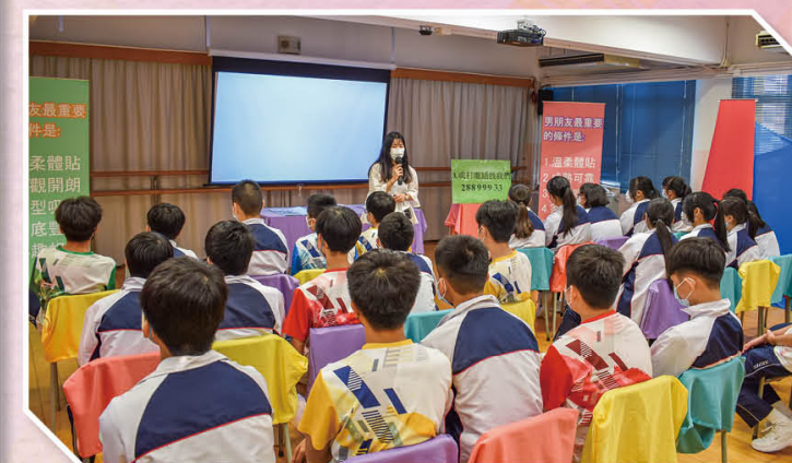
中二級性教育日營