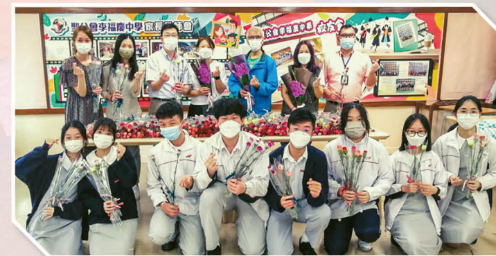
父母親節康乃馨敬贈活動

在升學及生涯規劃方面，各級設有不同的生涯規劃主題：自我認識(中一)、發掘夢想(中二)、選科抉擇(中三)、思考未來發展及職業取向(中四)、尋找人生升學及就業目標(中五)、升學及求職裝備(中六)。本校致力為學生編排各類型的體驗活動及講座等，協助學生探索個人興趣及長處。藉著不同的學習經歷和事業探索活動，協助學生認識各行各業的情況及各升學就業的途徑，為升學或就業作出明智的選擇。如中三「高中課程選科簡介會」及「模擬選科活動」、中四「自我探索工作坊」、中五中六「大學聯招選科簡介」、「非本地升學講座」、「VTC課程簡介講座」、「我要做老闆」、「模擬企業」等。當中，中四級更設有「職業體驗課程」，包括咖啡沖調、網上推廣及設計、專業化妝、物理治療助理、社交款待及餐桌禮儀、健身指導、短片拍攝及配音、日語初階，以及寵物美容等，課程內容與生活息息相關，讓學生更能了解職業特質，配合其他職涯講座，學生亦能及早做好生涯規劃，訂立清晰目標。