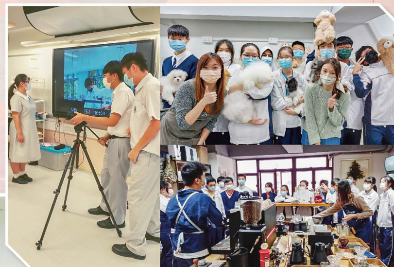
中四職業體驗課程