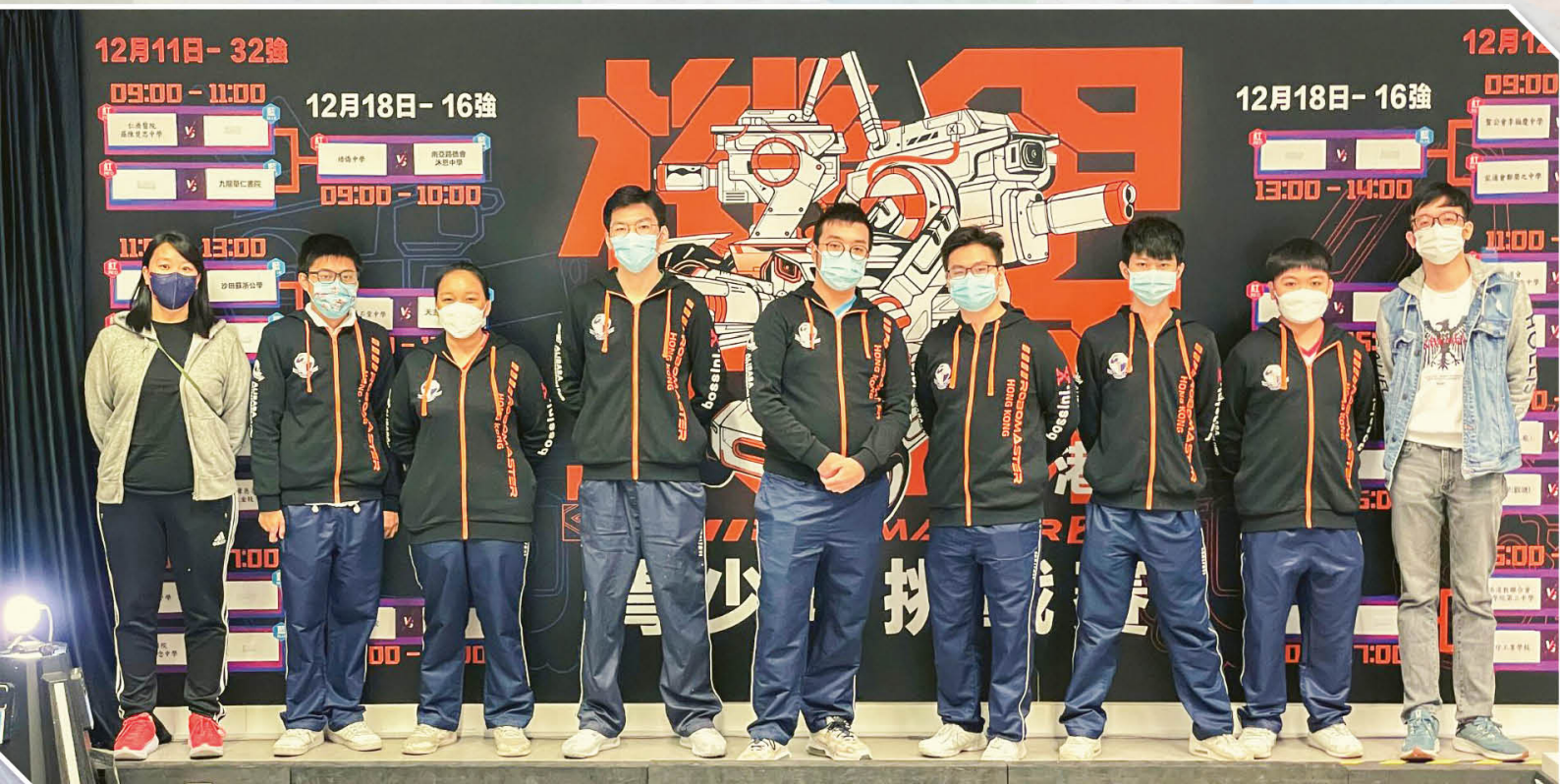
參與RoboMaster 2021青少年挑戰賽