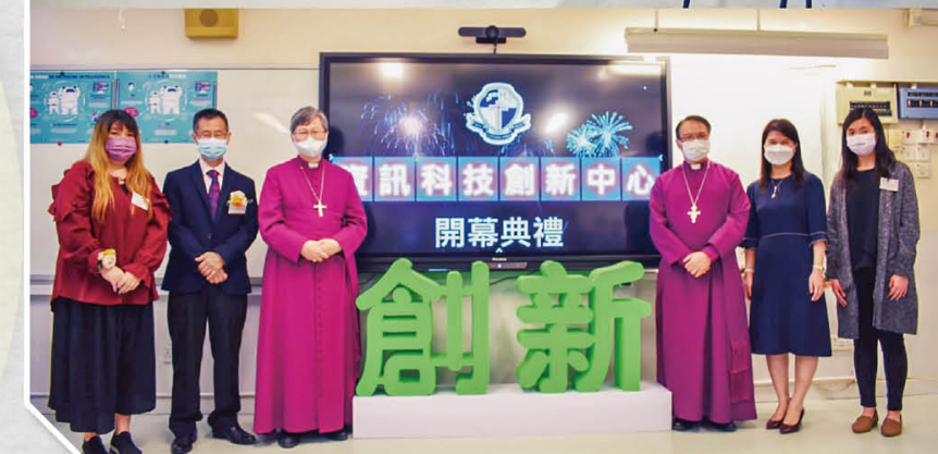
資訊科技創新中心