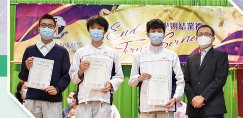
2022亞洲國際數學奧林匹克公開賽 《(AIMO Open)晉級賽》(高中組別)銅獎