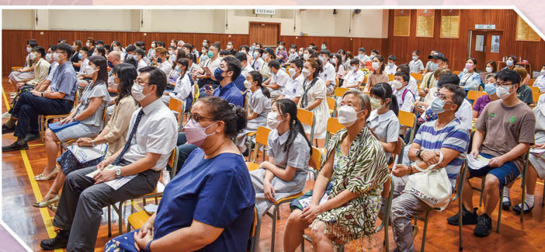
定期舉辦家長活動，促進家校合作。