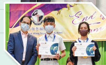
Eurasian Spelling Bee Lexical Skills Competition Excellent and Merit Awards