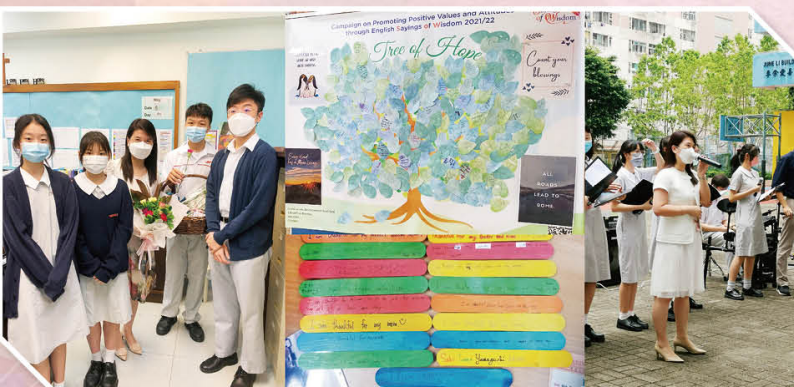
校園洋溢關懷與鼓勵