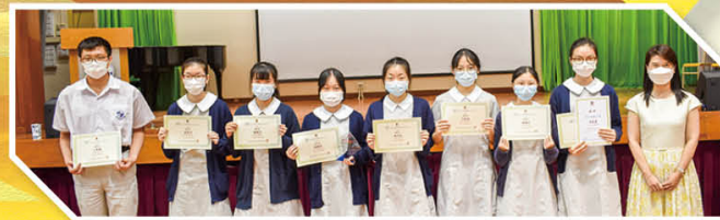
TEENS 健康獎勵計劃健康校園大獎