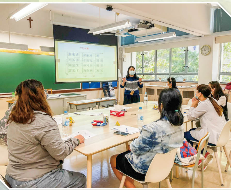
家長學堂_如何提升子女的學習效能