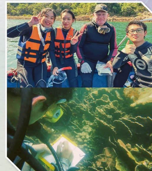
探究海水溫度及珊瑚健康關係活動