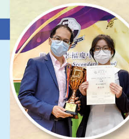
「疫症無情，人間有情」 徵文比賽三等獎