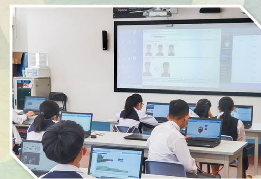
創造人工智能 AI Maker 工作坊