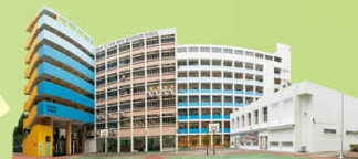
聖公會李福慶中學