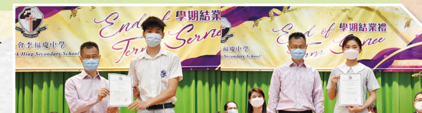
明日之星上游獎學金