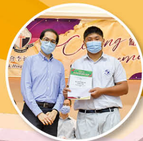
香港島傑出學生選舉 分區優秀學生獎