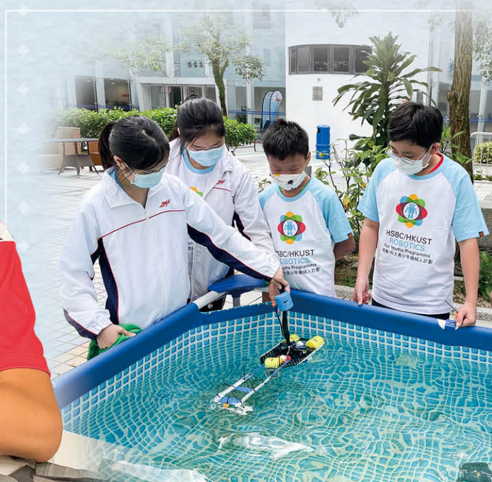
參與「香港科技大學水底機械人大賽2021」