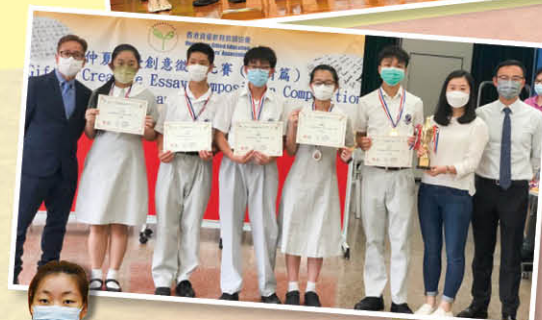
勇奪「仲夏資優創 意徵文比賽」金獎