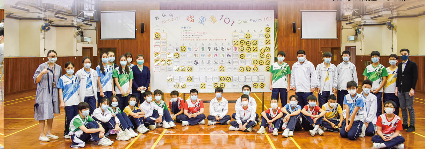
數理週「腦震盪101」活動