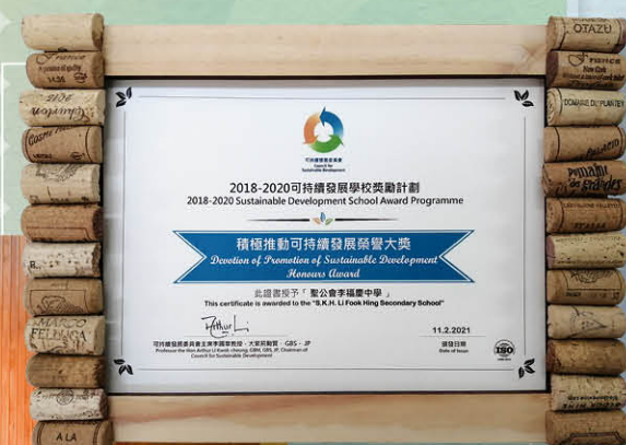
獲頒「可持續發展榮譽大獎」