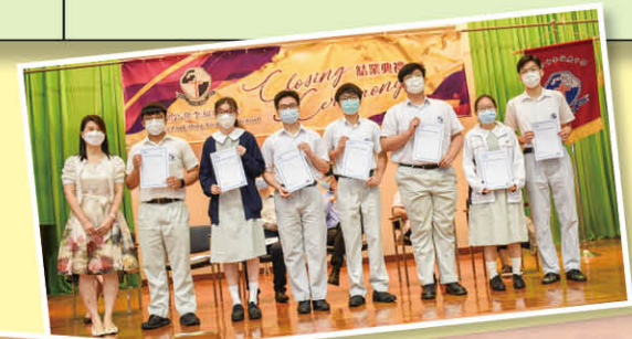
本校學生榮獲ICDL 國際資訊技能認證