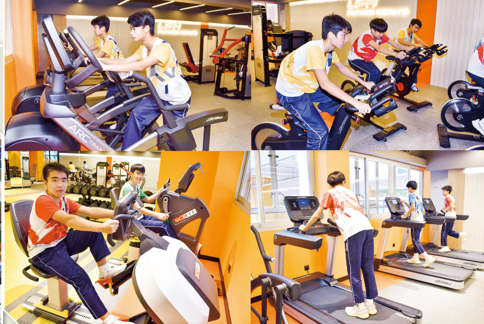
新建成的全天候健身中心