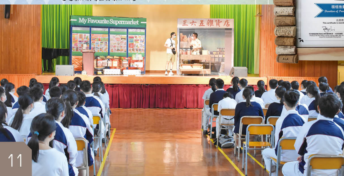
透過環保劇場宣揚環保訊息