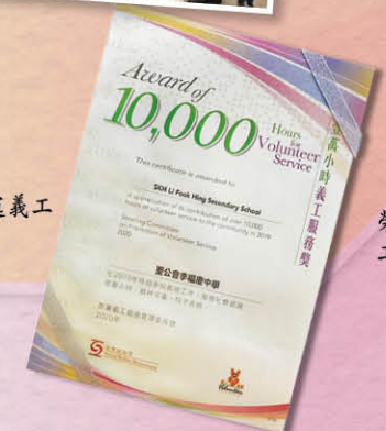
榮獲「壹萬小時義 工服務」大獎