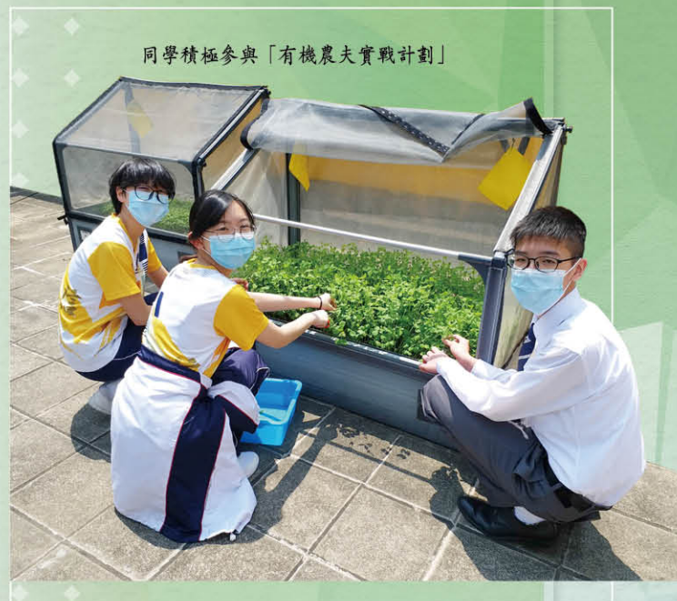
同學積極參與「有機農夫實戰計劃」

本校持續優化環保硬件設施，繼全面更換天台環保園大型太陽傘後，本學年又更換天台環保園小溫室種植箱及更新校園植物標籤牌，讓綠色元素遍佈校園。