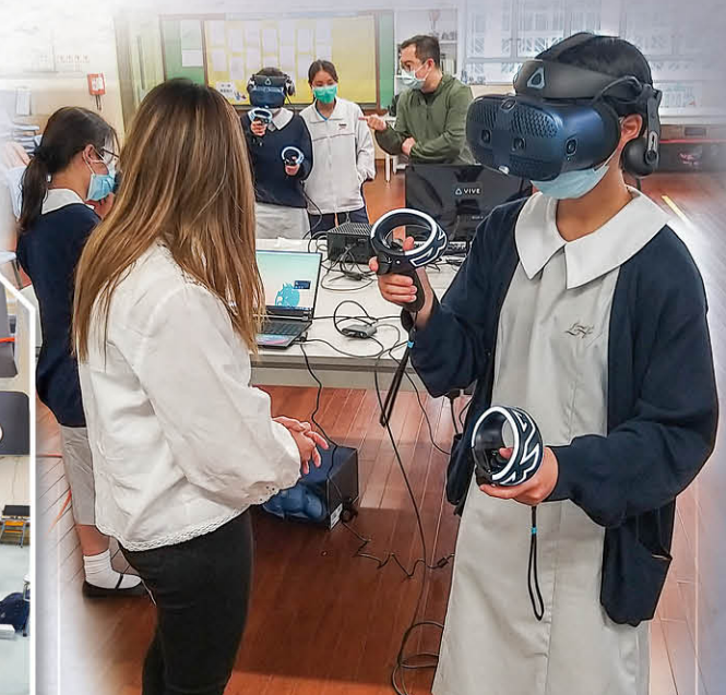
利用VR技術觀賞藝術作品