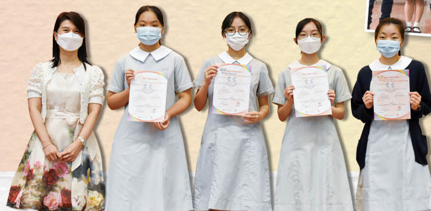
獲頒社會福利處義工 嘉許狀銀獎