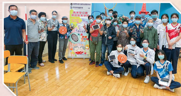
「長者學苑耆趣同飛無人機」義工活動