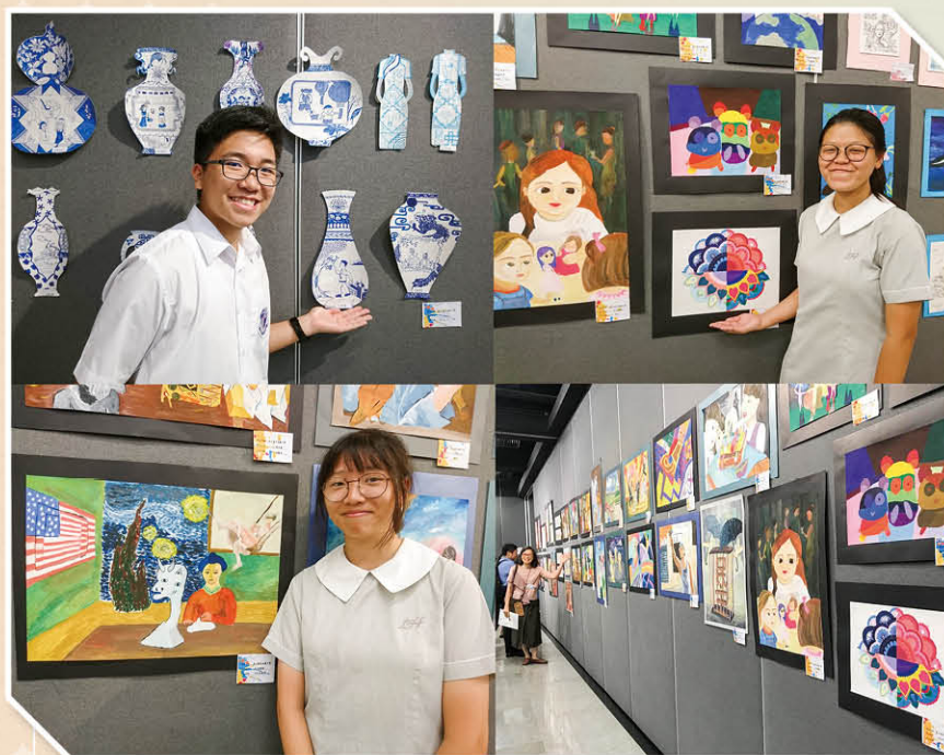
參與校外視藝活動

本校多年來在啟發學生潛能的工作上不遺餘力，在校長及老師的投入推動，師生的共同努力，取得「國際啟發潛能教育卓越成就獎」，努力得到國際專家肯定，全校師生均受極大鼓舞。