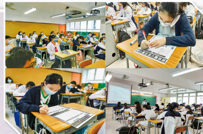
多元智能記憶訓練班