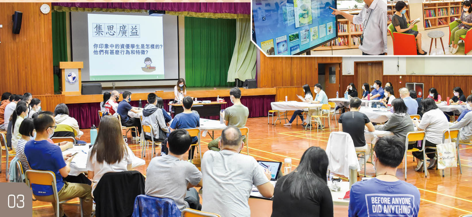
教師專業發展工作坊