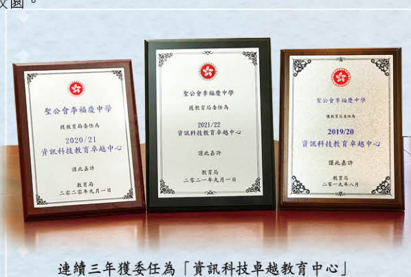
連續三年獲委任為「資訊科技卓越教育中心」