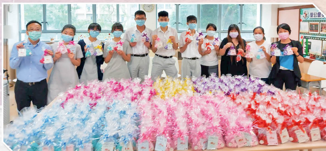
父母親節抗疫心意包敬贈活動