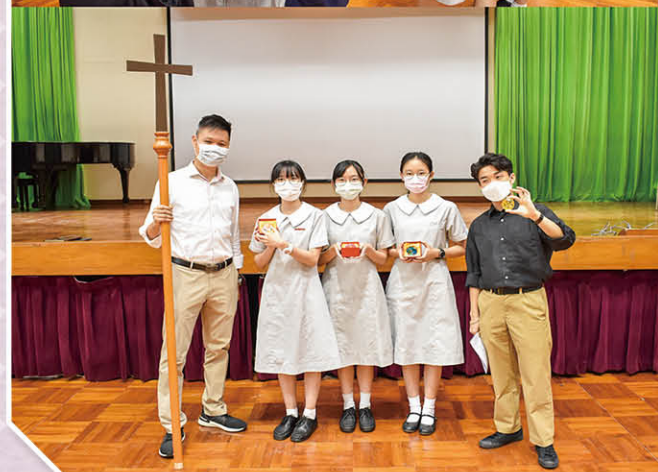
校長在「立願禮」上向每位學生送上「寶石」