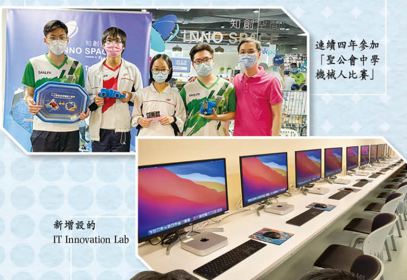
連續四年參加「聖公會中學機械人比賽」