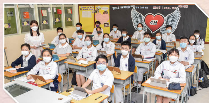
校園關愛文化濃厚