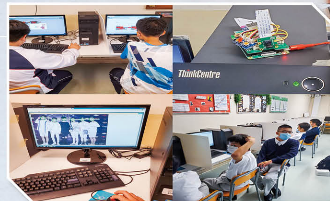
創造人工智能AI Maker 課程

本校亦積極舉辦不同的科技知識增潤活動，如創造人工智能AI Maker、編程式智能控制STEM及無人機、「體驗人工智能在無人駕駛車的實踐」工作坊、學習「Raspberry Pi單板計算機」等。同時，本校成功獲政府資訊科技總監辦公室「中學IT創新實驗室」計劃撥款，用作成立IT Innovation Lab，目前已添置蘋果公司最新的M1處理器並配備27吋4K超高解像度屏幕，為學生締造更完備的數碼校園。