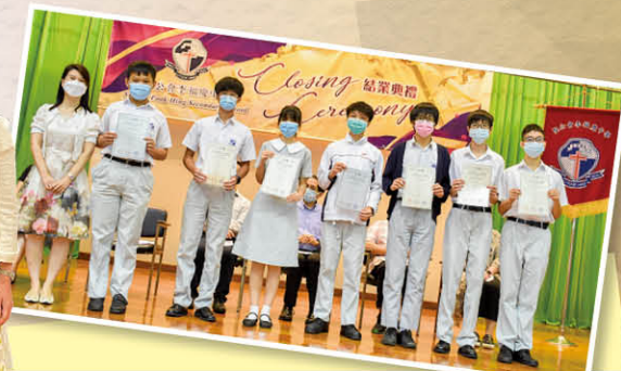
榮獲2021亞 洲國際數學 奧林匹克公 開賽晉級賽 銀獎及銅獎