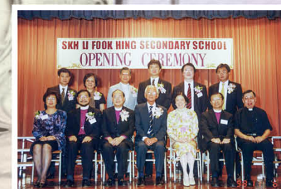
嘉賓出席學校開幕禮