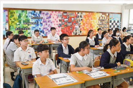
為初中學生舉辦多元智能記憶力提升班

在教師專業發展方面，本校以「加強學校中層領導及提升教師評估素養計劃」成功申請「優質教育基金專項撥款」，並參加「香港中文大學優質學校改進計劃」，開展一系列教師發展專題工作坊。此外，「香港教育大學及人類發展學院之課程與教學學系」與本校通識科及中國歷史科合作「元認知」教學策略，提升教師的教學容量。在校內，本校已建立共同備課、同儕觀課、公開課及評課文化，持續優化學與教策略。