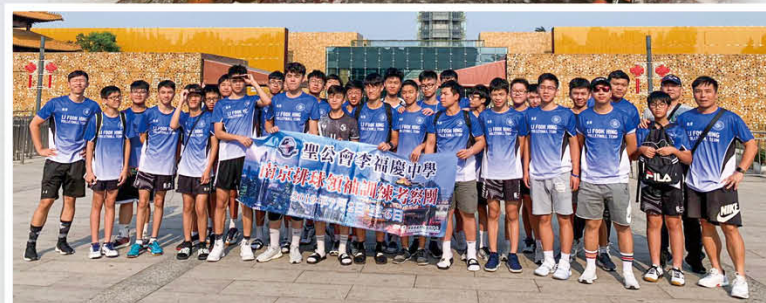
本校男子排球隊到南京集訓