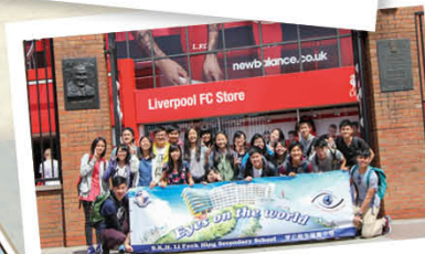
英國利物浦交流團