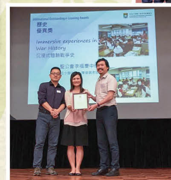
國際傑出電子教學獎