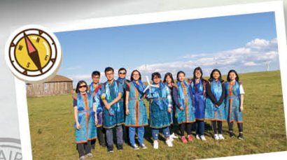
內蒙古歷史文化及自然生態考察之旅