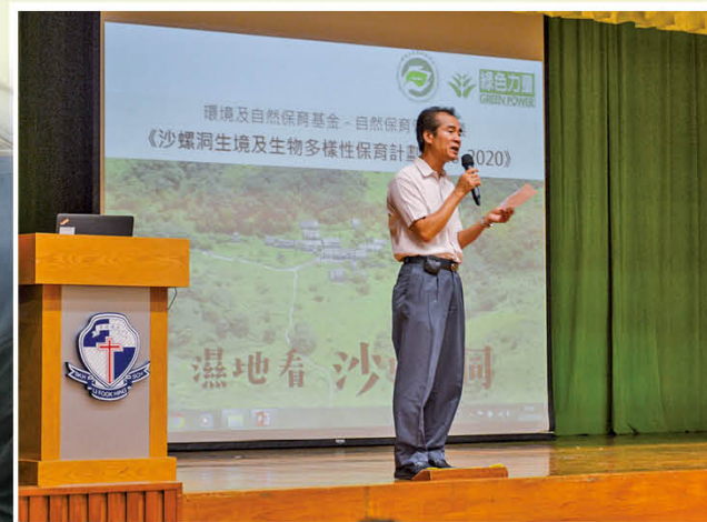
定期舉辦環保講座推廣綠色力量