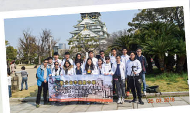
日本大阪與廣島考察團