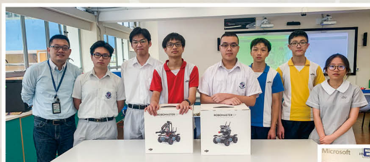
添置智能機械人，增潤學習樂趣。

此外，本校建構數碼化圖書館Library 3.0，利用電子資源及平台，提升電子化閱讀的互動性，並透過虛擬實境(VR)或擴增實境(AR)作閱讀推廣，讓學生掌握新技術製作多媒體閱讀報告。本校亦透過遙距線上形式，教授學生人工智能(AI)課題，又透過線上視像會議軟件，讓學生參與協作式的互動學習。