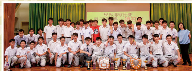
學界排球(港島)男子團體總冠軍