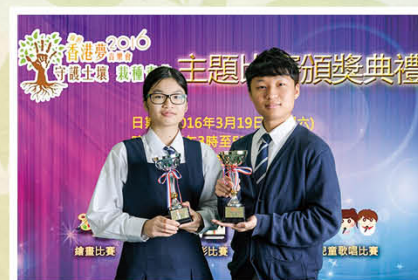
我的香港夢繪 畫比賽冠軍