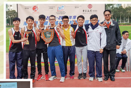
港島及九龍區校際田 徑比賽男子甲組團體 總冠軍