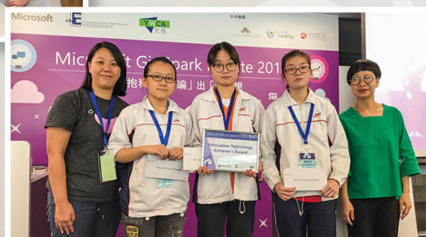
參與校外STEM公開比賽