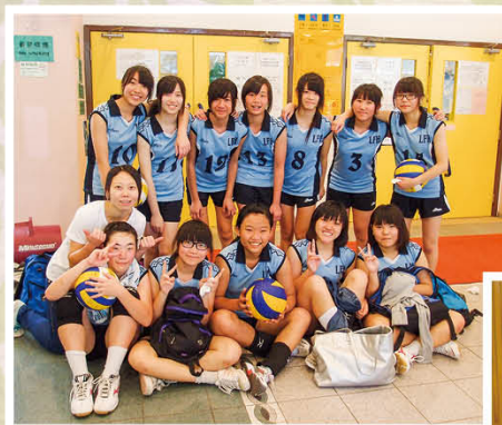
女子排球隊首奪港島區第二組學界排球賽 女乙組冠軍