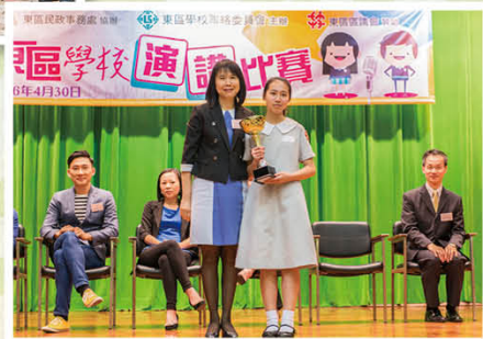
東區學校演講比賽中學初級組冠軍