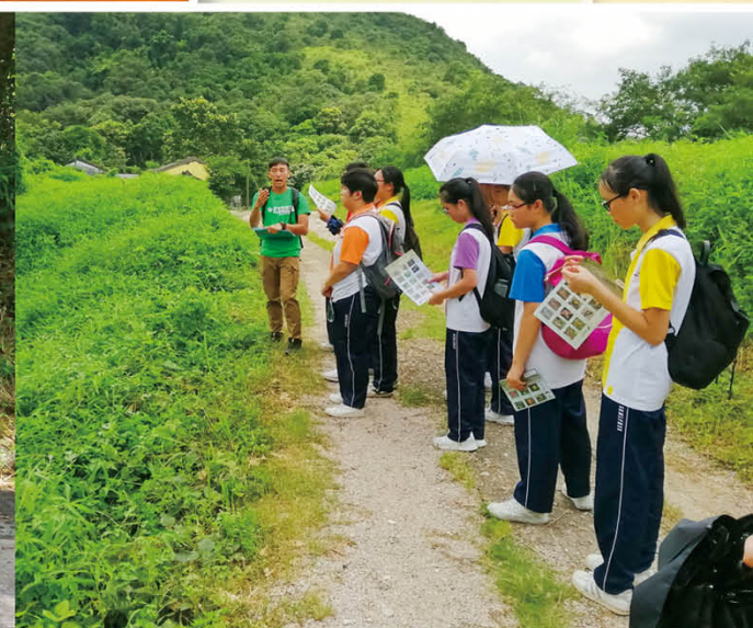
透過環保考察增潤學生保育意識