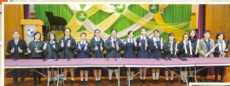
香港國際手鈴奧林匹克手鐘條比賽銀獎