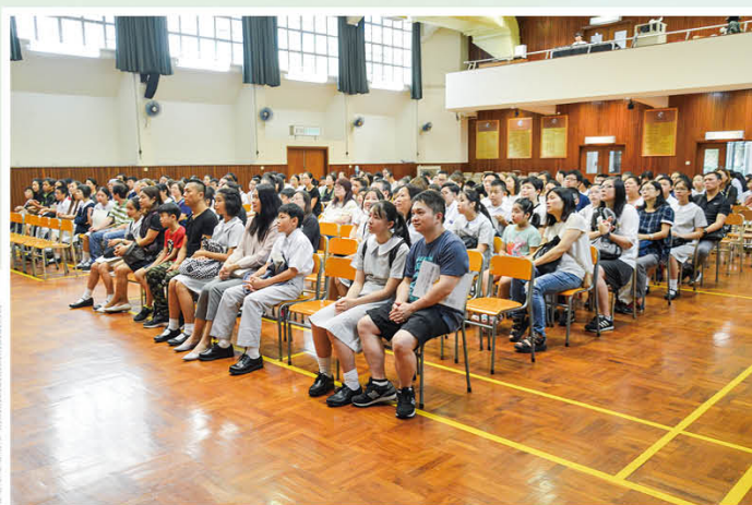
定期舉辦家長講座