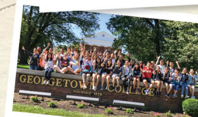
美國喬治城交流團