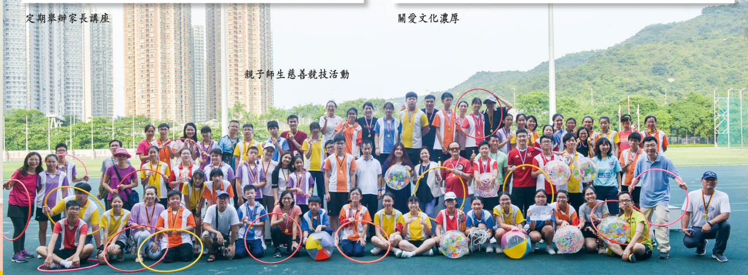
親子師生慈善競技活動