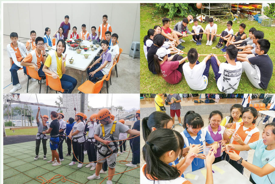
舉辦提升抗逆能力活動