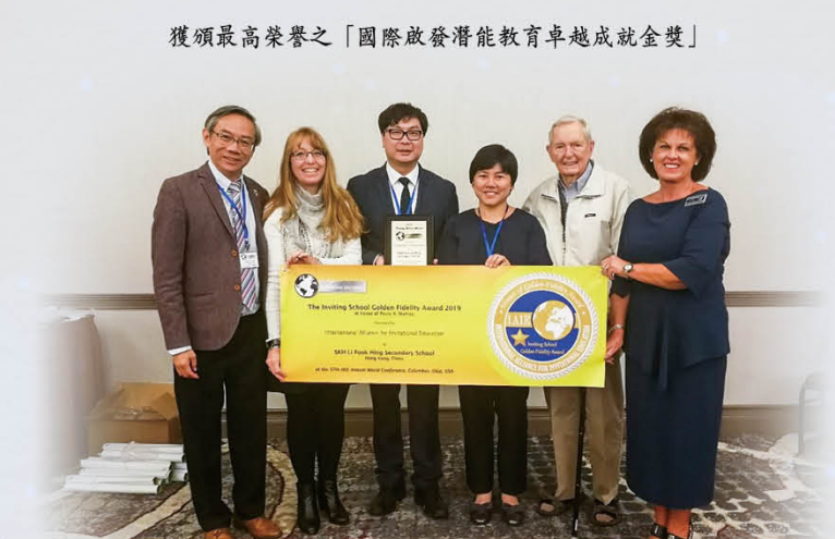
獲頒最高榮譽之「國際啟發潛能教育卓越成就金獎」