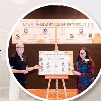
本校教師參與香港教育大學培訓計劃