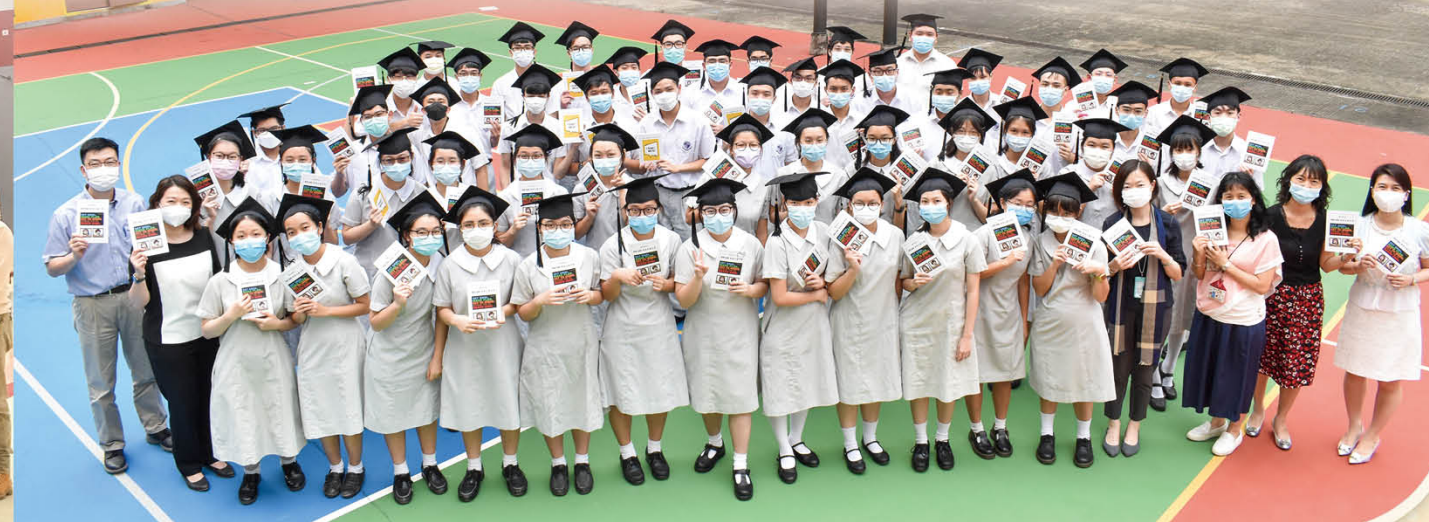
為應屆文憑試生舉辦應試活動