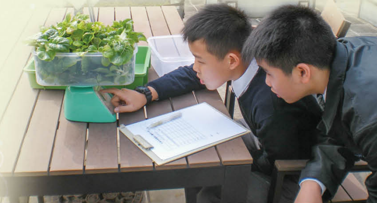
有機蔬果種植比賽

本校持續優化環保硬件設施，本學年全面更換天台環保園大型太陽傘，並翻新種植設施及維修所有小溫室，為師生創造更完善的綠色校園。