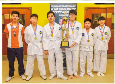
第七屆學界跆拳道暨亞洲邀請賽中學 學界組全場總冠軍