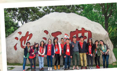
西安歷史文化交流團