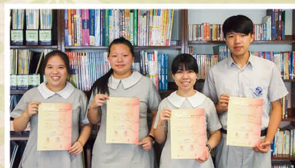
社會福利署義工嘉許狀金獎