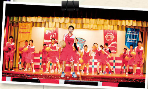
2012-2013 《High School Musical》