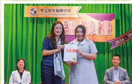
學校音樂節19歲以下女高音亞軍