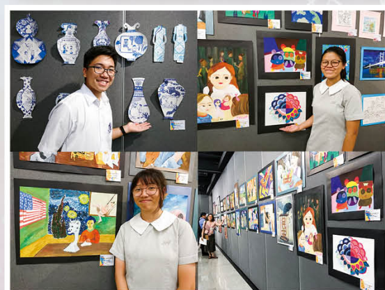
參與校外視藝活動，展現藝術才華。