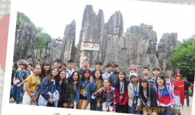
雲南地質遺蹟考察團