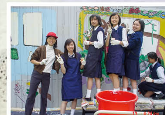
視藝科為興建新翼時的圍板進行壁畫創作比賽