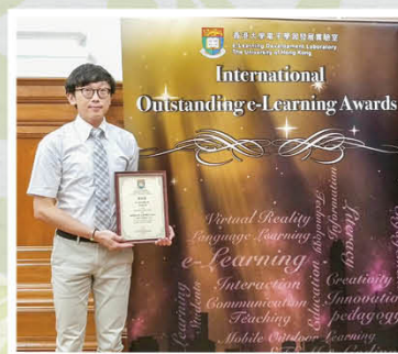
國際傑出電子教學獎