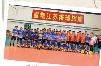
南京排球領袖考察團