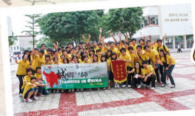
城鄉小老師清遠之旅