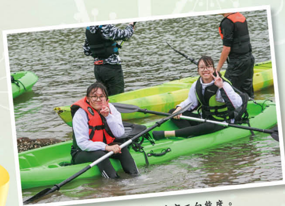
透過歷奇活動，培育正向態度。

學校與家庭是學生成長路上的重要伙伴，本校與家長教師會攜手合作，鼓勵學生積極進取，透過舉辦不同類型的活動，致力培養學生的全面發展。每年舉辦家長講座、親子師生慈善跑、「親子堆沙比賽暨繽紛同樂日」、燒烤晚會等活動，促進親子關係。