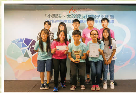
「小想法,大改變」2016社創點子比賽 團體賽季軍