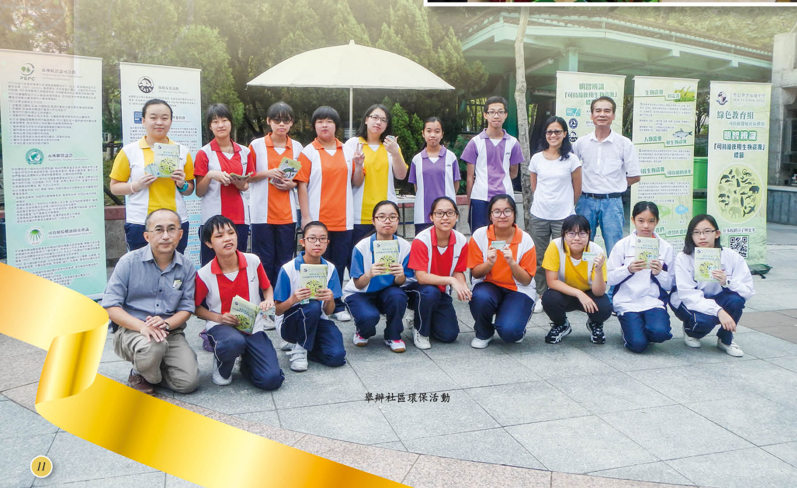
舉辦社區環保活動