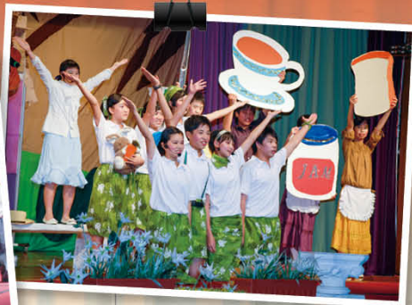
2008-2009 《Sound of Music》