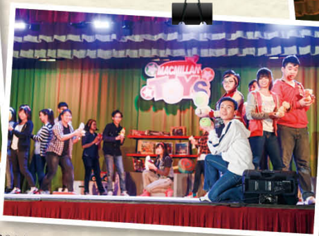
2014-2015 《BIG, the Musical》