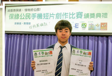
全港保綠公民手機創作比賽 最具創意大獎