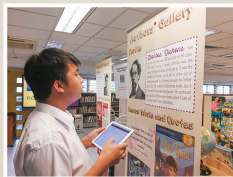
利用平板電腦推廣閱讀活動