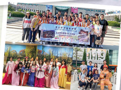
生涯規劃韓國考察團