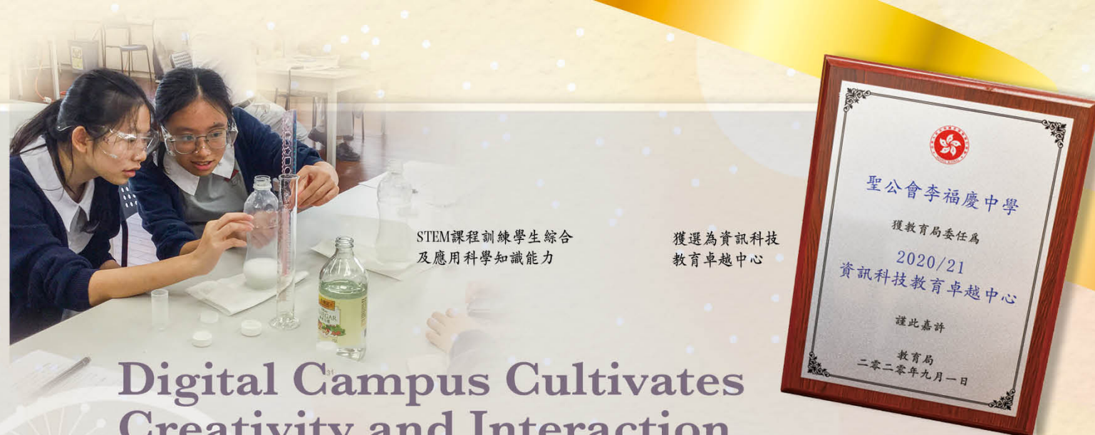
STEM課程訓練學生綜合及應用科學知識能力