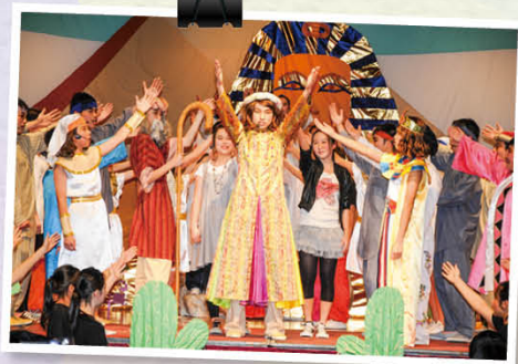
2010-2011 《Joseph and the Amazing Technicolor Dreamcoat》