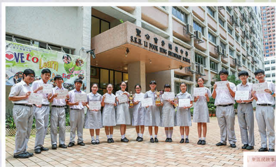
全國青少年語文知識大賽現場作文公開賽 (香港區)中學團體總冠軍