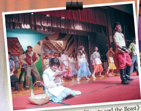
2007-2008 《Beauty and the Beast》