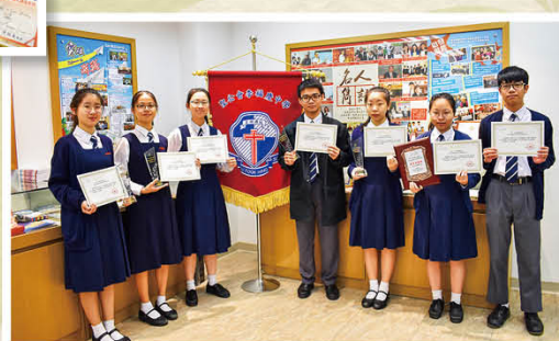
深港澳中學生讀書隨筆大賽一等獎