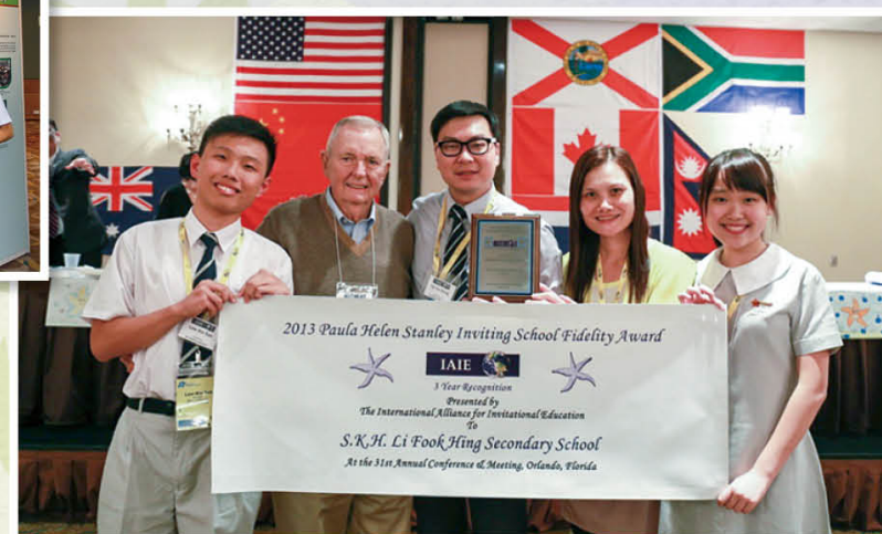
啟發潛能學校成就大獎