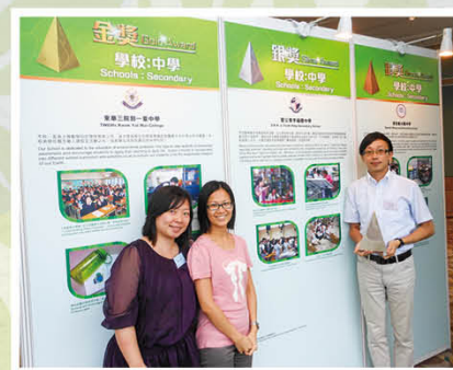
香港環保卓越計劃——中學界別 卓越大獎(銀獎)