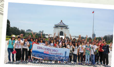
台北、台中升學交流團