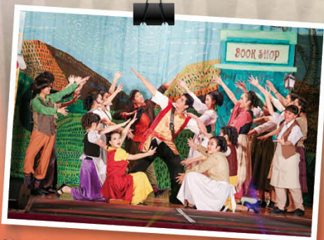
2016-2017 20th 周年校慶 《Beauty and the Beast》