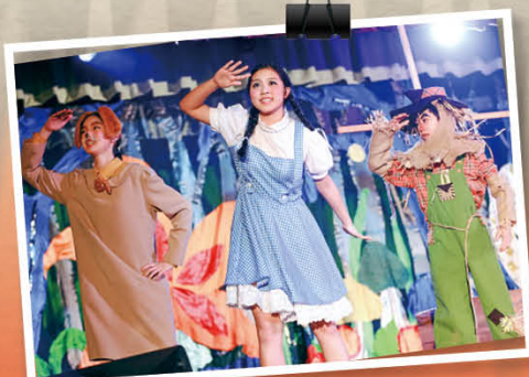
2018-2019 《The Wizard of Oz》