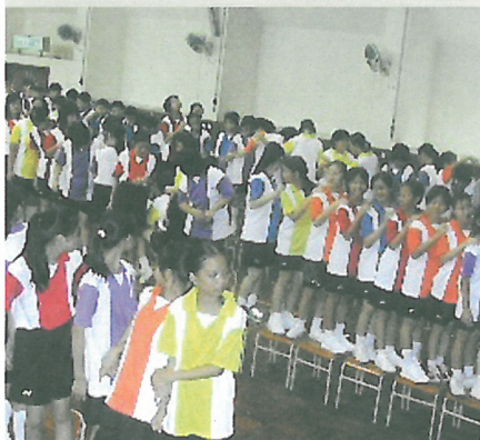
中一迎新日排排企，玩遊戲，加強同學的合作及歸屬感