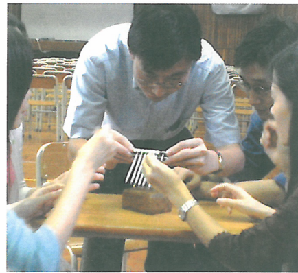
將十八口釘放在一口釘子上？這個難題一下子就被充滿創意思維的老師解決了。

本校於今年成立了課堂研究小組 (Lesson Study Group)，並與香港教育學院 (HKIED) 結成合作夥伴，希望透過一連串的校內觀課、課堂研究等，提高教學質素，並加強老師之間的聯繫，支持及討論風氣，從而令學生得到最大的裨益。