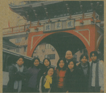
廣州韶關環保考察師生於韶關實地考察環保發展情況。