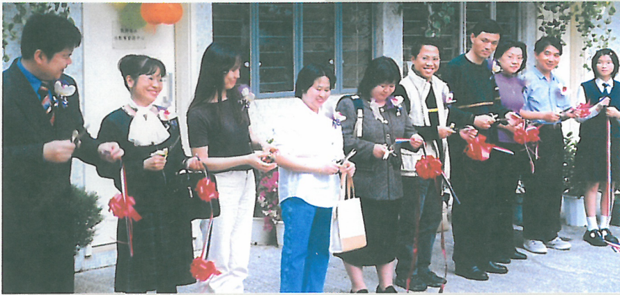
家長教師性教育資源中心開幕剪綵