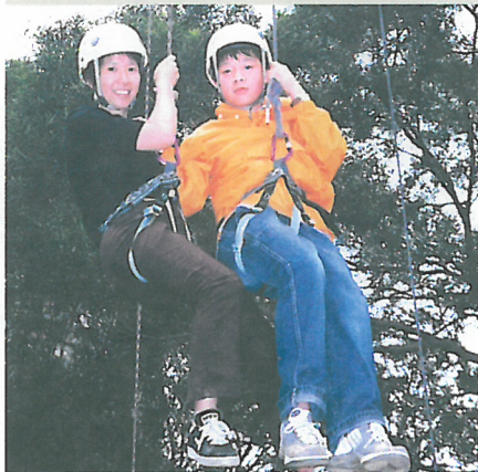
家長學生同闖難關