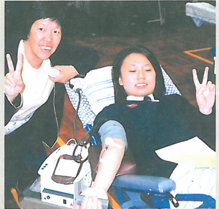
師生齊捐血顯愛心