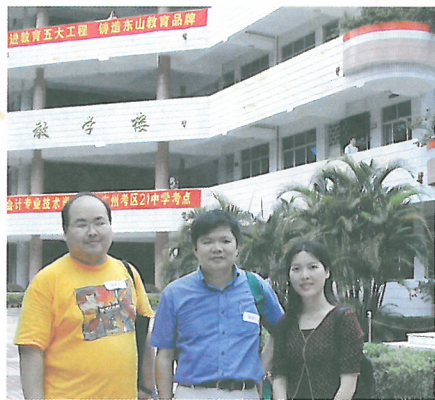
校長與老師到廣州市綠色學校觀摩交流環保教育經驗